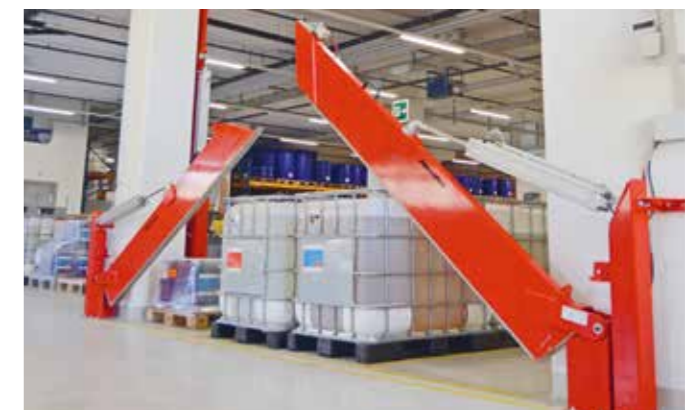
Paratia per acqua a uso antincendio montata in modo fisso con sbloccaggio e ritorno automatici