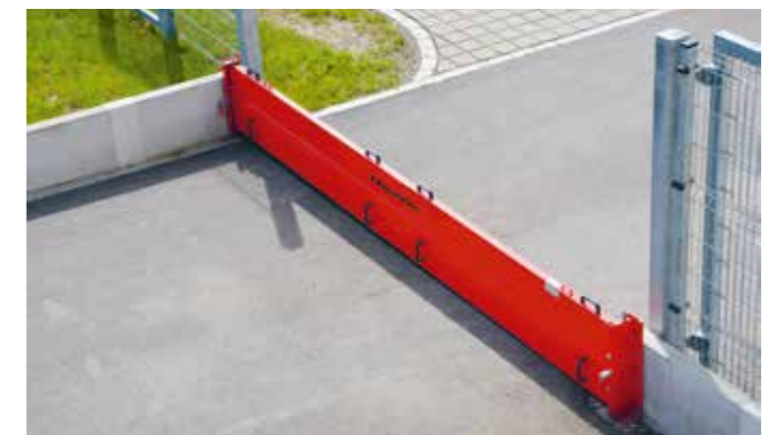
Sistema di contenimento mobile