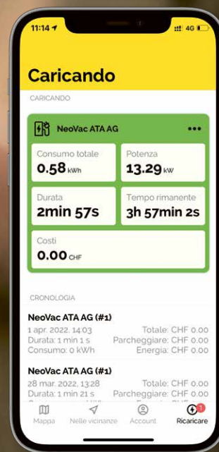
«NeoVac myCharge» in dettaglio: neovac.ch/it/mycharge

Potete consentire l'avvio, la cessazione e il pagamento delle operazioni di ricarica nella vostra rete direttamente dallo smartphone. Con «NeoVac myCharge» i vostri e le vostre clienti o gli inquilini trovano le stazioni di ricarica per veicoli elettrici disponibili pubblicamente attraverso la rete partner di NeoVac o abilitate in reti private.