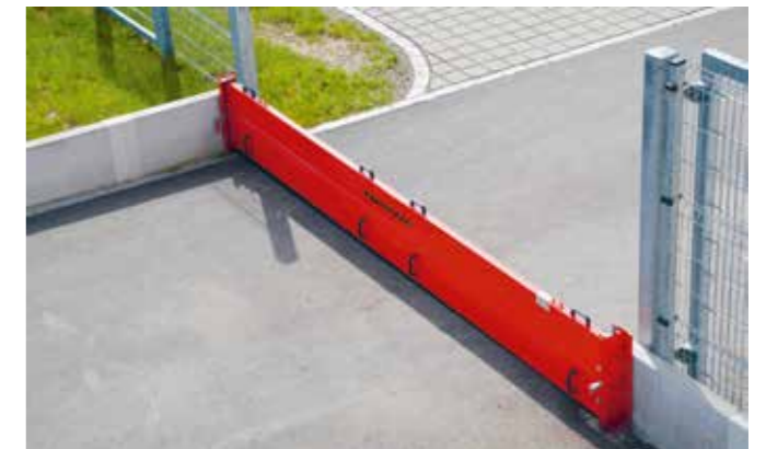
Système de retenue mobile